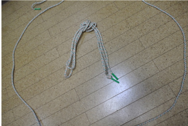
1本あたりの長さは4.2m

全員で一斉に跳ぶ大縄跳びとしても(左下)、2人組で速さを競うリレー形式でも(右下)楽しめます。また輪を作って鬼ごっこなどに活用することも可能です。